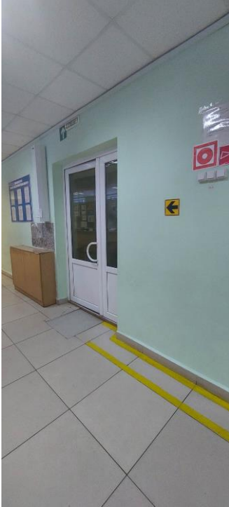
Фото 9. Пути эвакуации