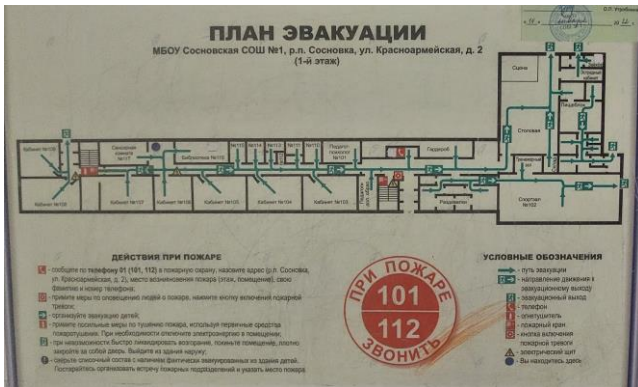
Фото 16. План эвакуации (1 этаж)