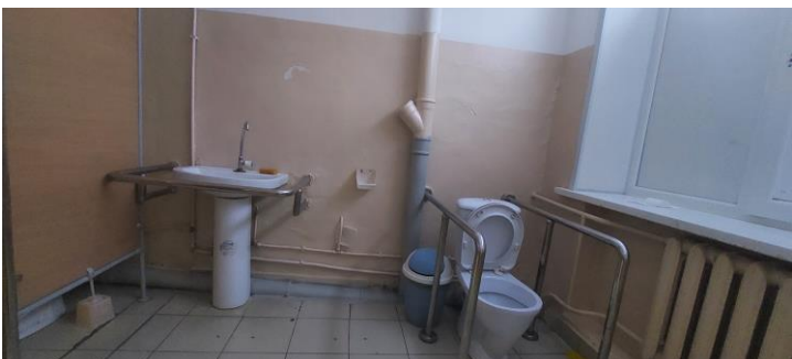
Фото 11. Туалетная комната