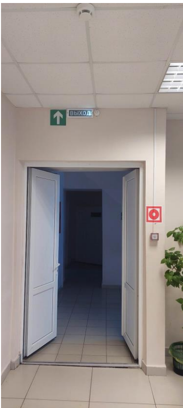
Фото 15. Акустические средства (сигнализация)