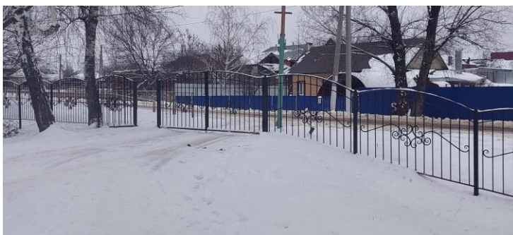
Фото 2. Вход (въезд) на территорию