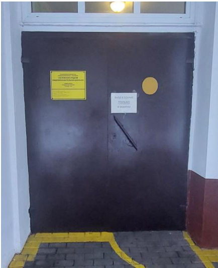
Фото 14. Тактильные средства