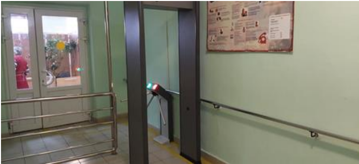
Фото 6. Тамбур