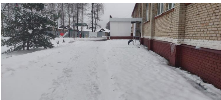
Фото 3. Путь движения на территории