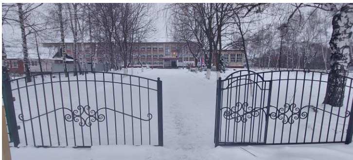
Фото 1. Вход на территорию