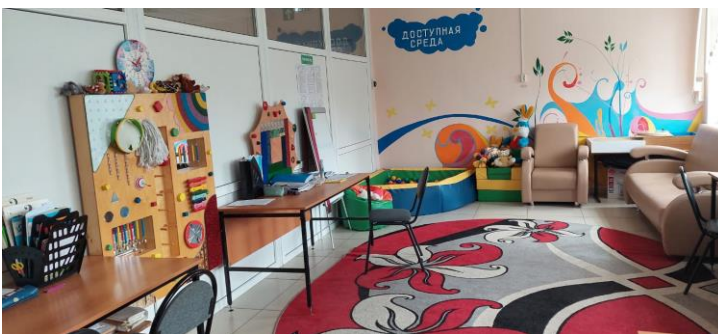
Фото 10. Зальная форма обслуживания