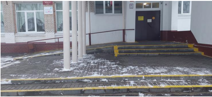
Фото 5. Вход в здание