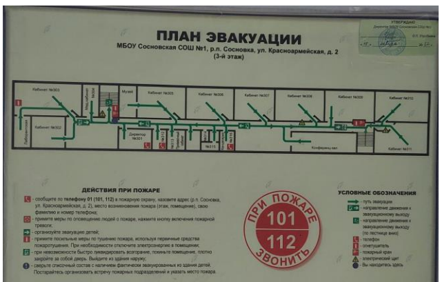
Фото 18. План эвакуации (3 этаж)