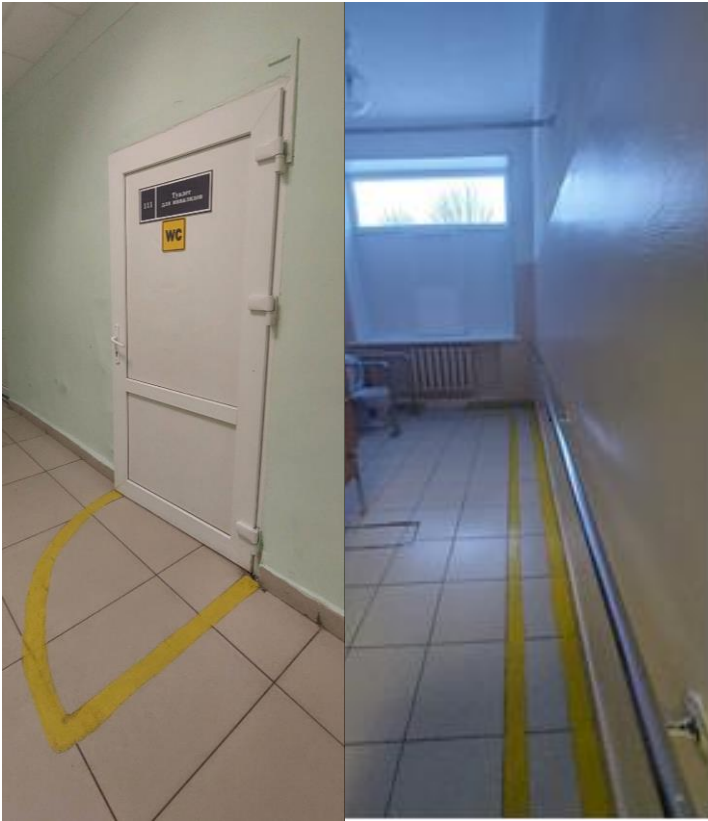
Фото 12. Вход в туалетную комнату