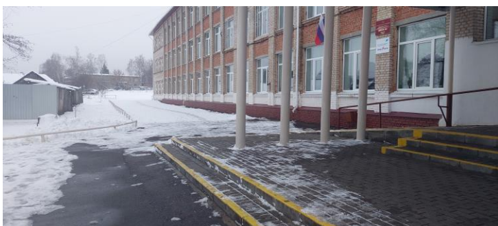
Фото 4. Путь движения на территории