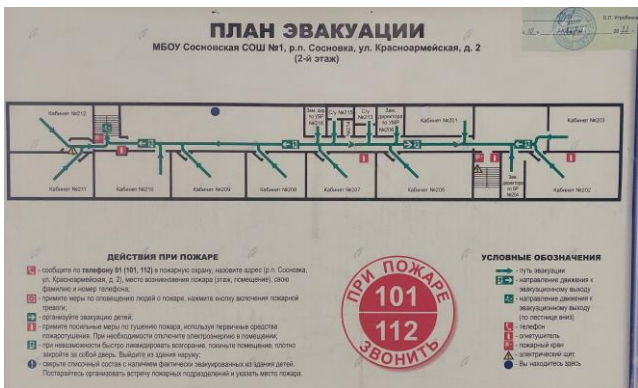
Фото 17. План эвакуации (2 этаж)