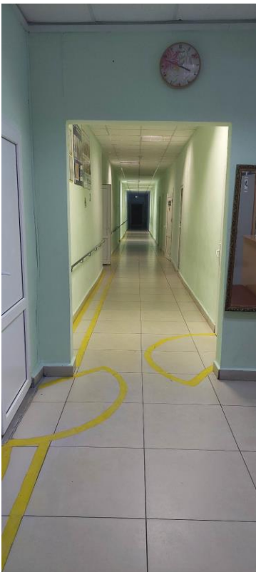
Фото 7. Коридор