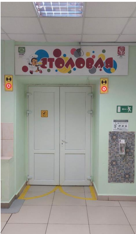
Фото 13. Визуальные средства.