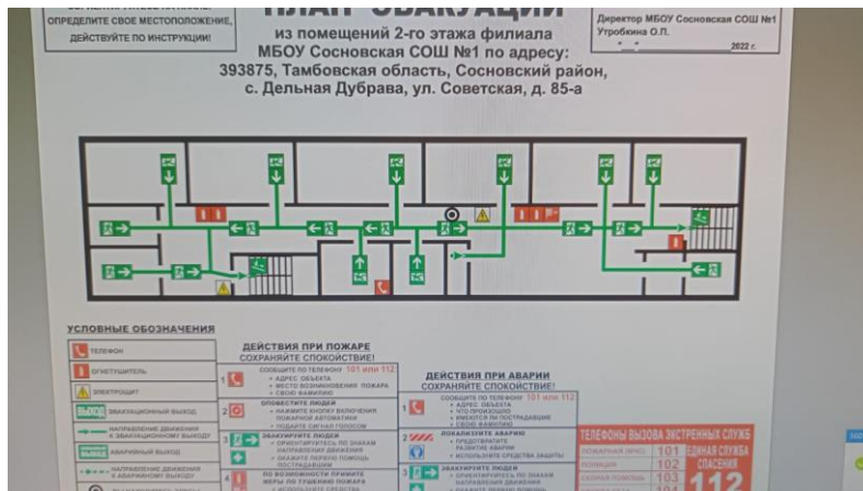
Фото 17. План эвакуации (2 этаж)