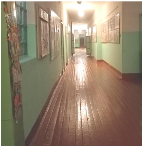
Фото 8. Коридор