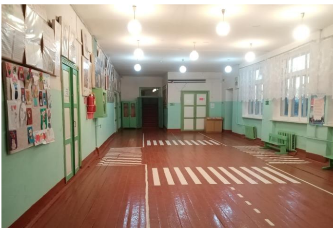
Фото 11. Рекреация (1-й этаж)