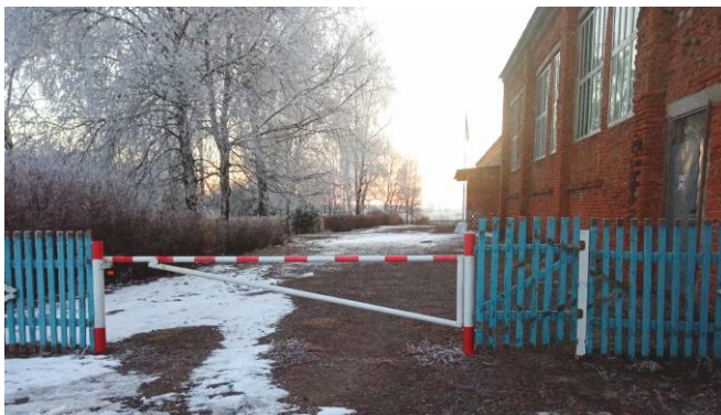
Фото 1. Вход (въезд) на территорию