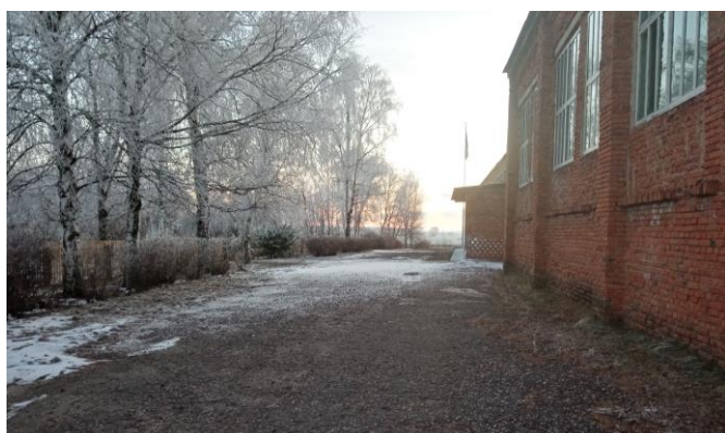
Фото 4. Путь движения на территории