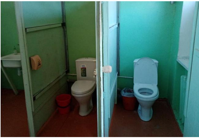
Фото 12. Туалетная комната