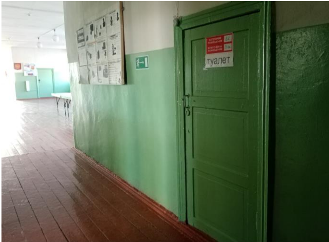
Фото 13. Вход в туалетную комнату