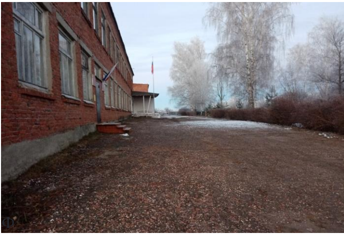
Фото 5. Путь движения на территории