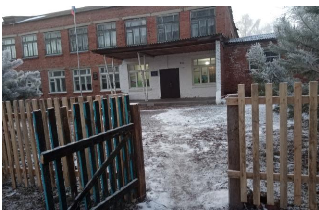
Фото 3. Вход на территорию