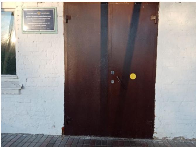
Фото 14. Тактильные средства