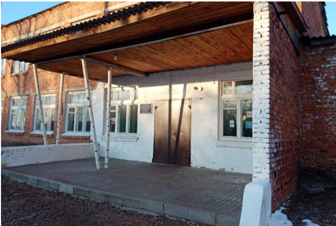
Фото 6. Вход в здание