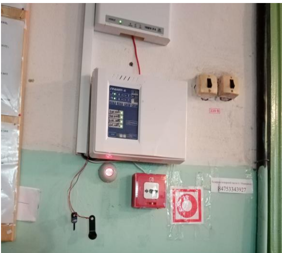
Фото 15. Акустические средства (сигнализация)