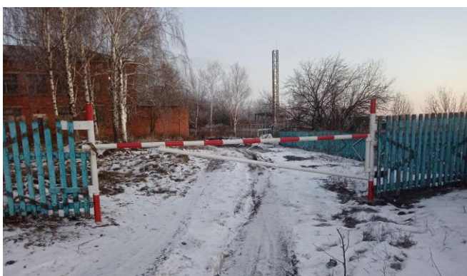
Фото 2. Вход (въезд) на территорию