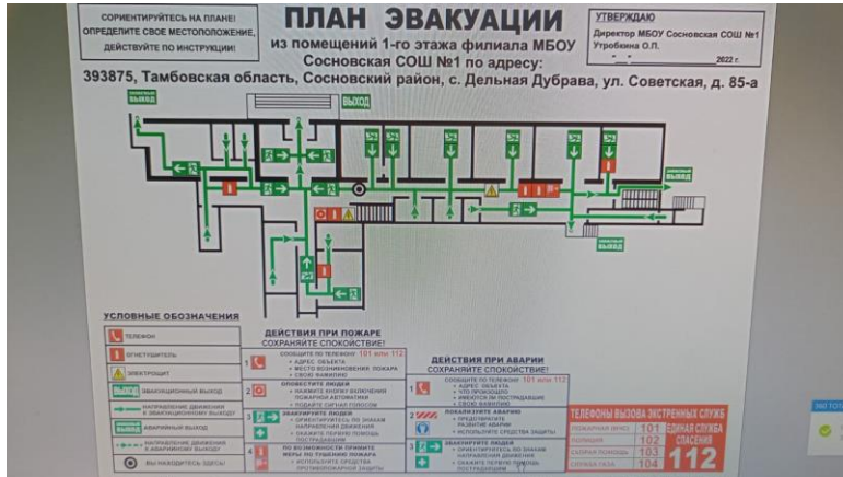
Фото 16. План эвакуации (1 этаж)