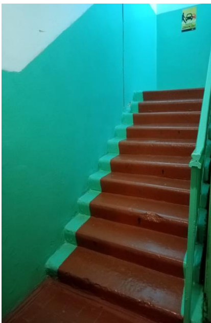
Фото 9. Лестница (внутри здания)