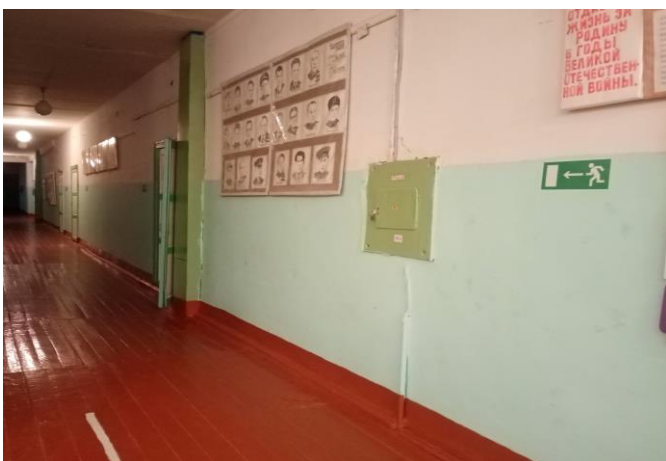
Фото 10. Пути эвакуации