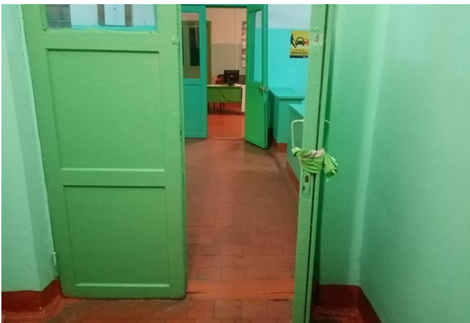
Фото 7. Тамбур